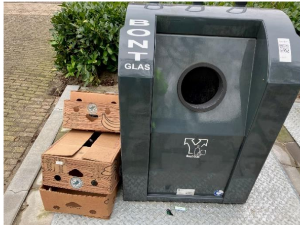
79418. Dumping afval bij container STB 511 R op de Oostdam. Afgehandeld 11-2-2024.